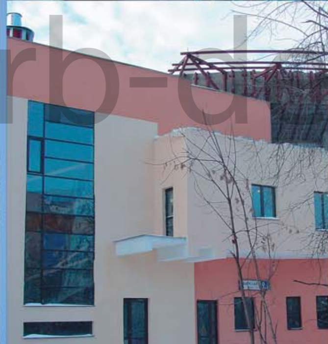
Киноконцертный зал «Украина» г. Москва, ул. Баркляя, вл. 9/2