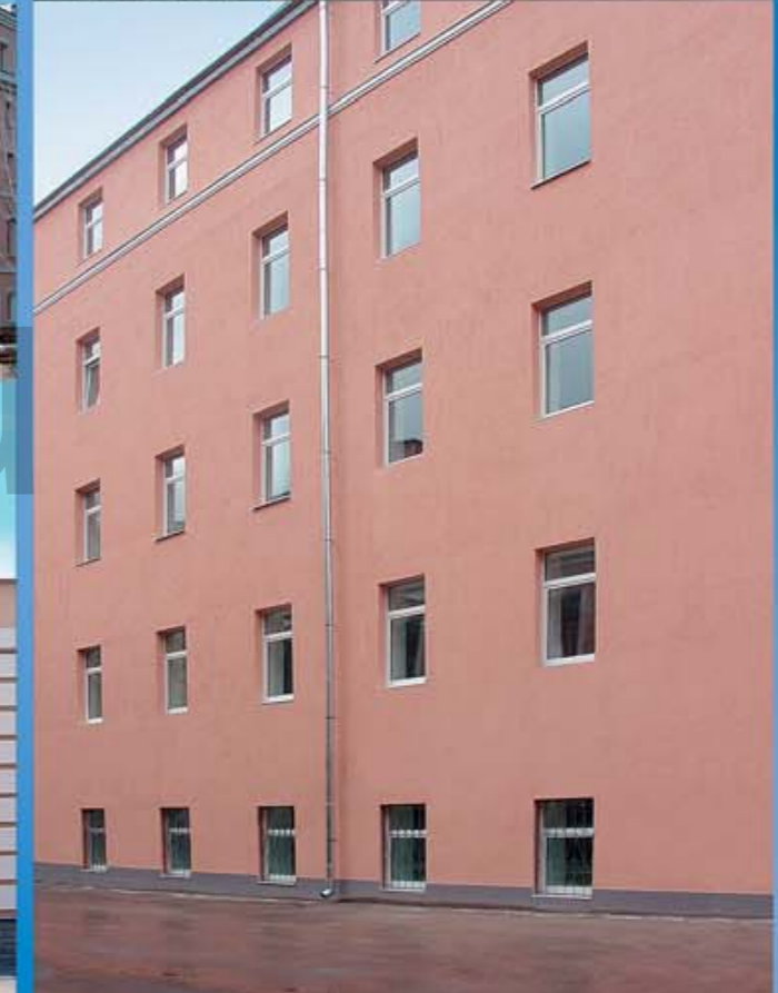
Офисный центр г. Москва, ул. Макаренко, д. 4 корпус 1