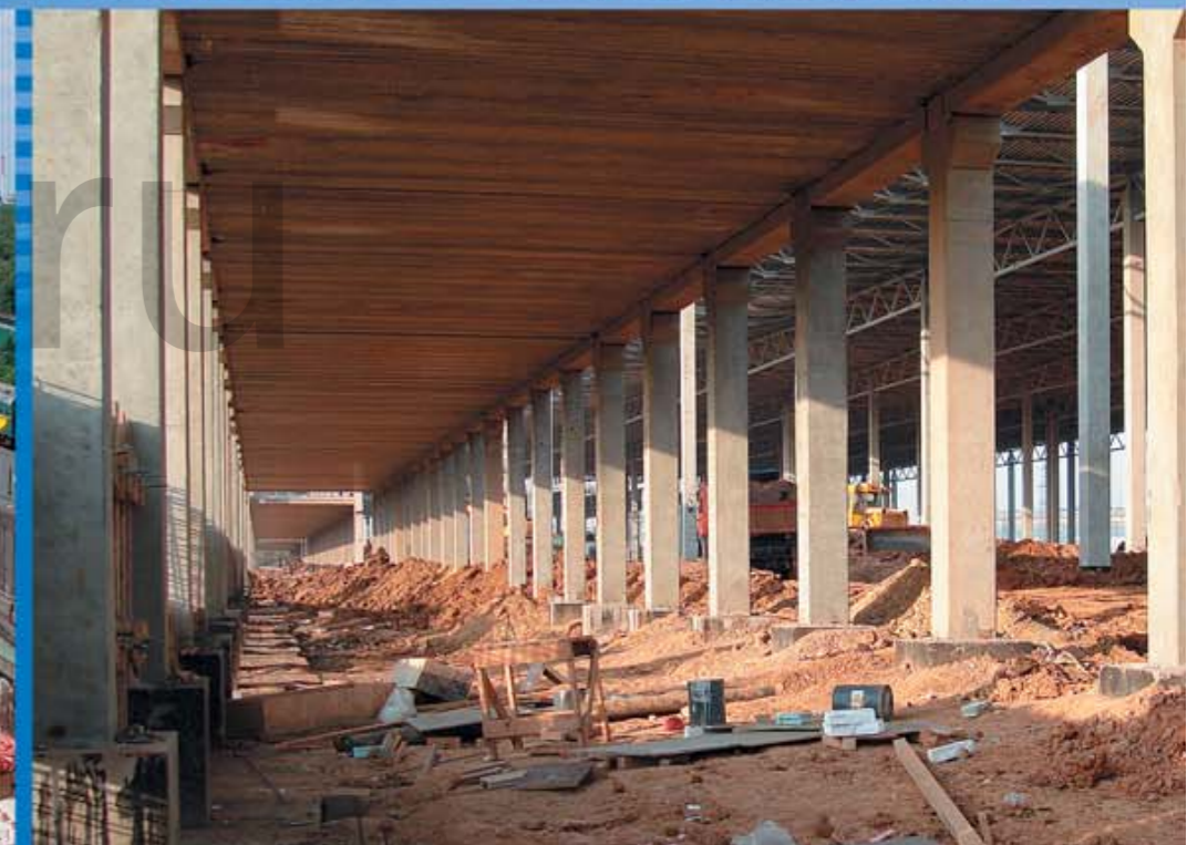
Торгово-досуговый комплекс «Тройка» г. Москва, Верхняя Красносельская ул, вл. 3А