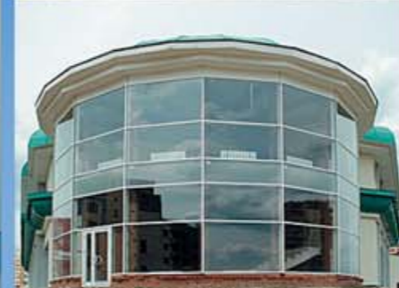
Фитнесс-клуб, косметический салон, супермаркет г. Москва, район Куркино, 14-й микрорайон, корпуса 1 а, 2 а, 3 а