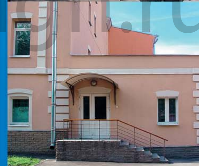
Психотерапевтическая поликлиника г. Москва, ул. Пантелеевская, вл. 20 стр. 1, 4