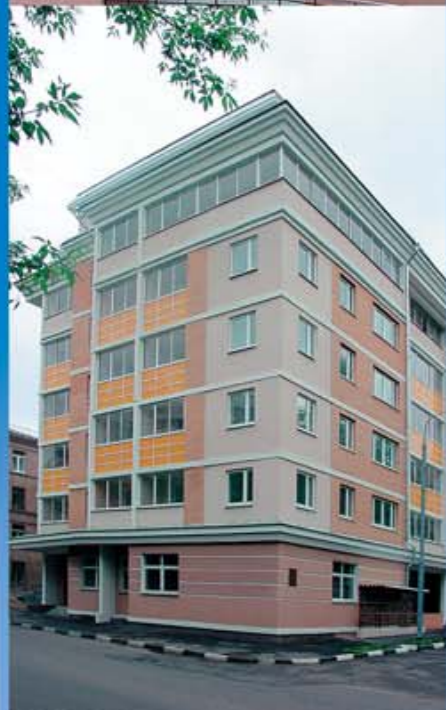
Монолитно-кирпичный односекционный жилой дом с подвалом и техническим этажом г. Москва, Денисовский переулок, вл. 22