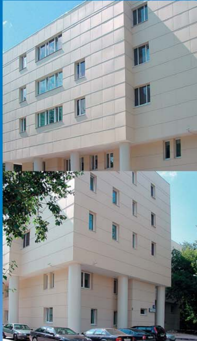
Здание НТЦ АИС «Агрохим» г. Москва, ул. Рабочая, д. 38