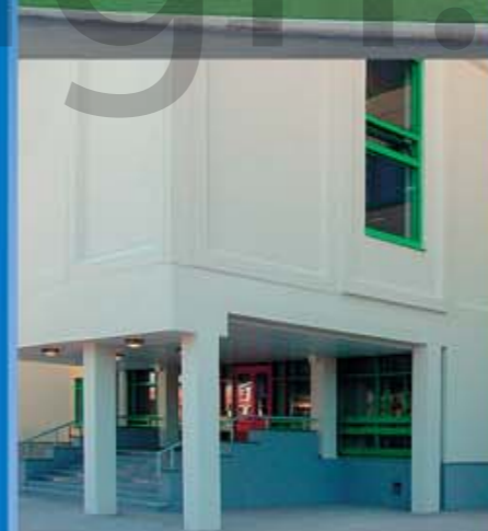
Общеобразовательная школа г. Москва, район Куркино, ул. Юровская