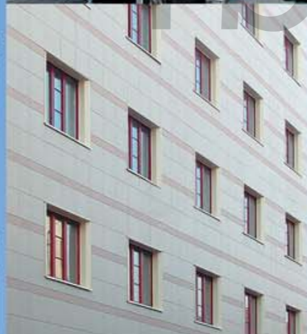
Кирпичный 5-6 этажный 2-секционный жилой дом со встроенными нежилыми помещениями г. Москва, Леонтьевский переулок, д. 2А