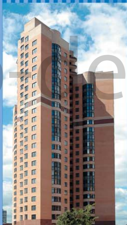
Монолитно-кирпичный дом переменной этажности г. Москва, ул. Нежинская, вл. 8–12, корпуса В–Г Возведение монолитного каркаса